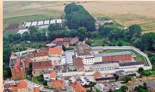
Tauben Ansicht auf Ichttershausen

Wer die Referenten sein werden, steht noch nicht fest. Jürgen Weichhold wird sich um Fachleute kümmern.