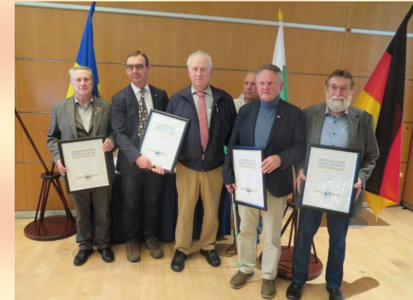
Die neuen Meister des VDT