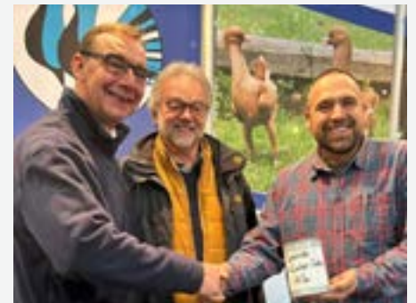
Im Zuge der VDT-Schau in Leipzig überreichte der Club der Brünnerzüchter zusätzlich nochmals eine Spende in Höhe von 1.000,00 EUR für die Kinderkrebsstiftung. Auf dem Foto die beiden Vertreter des SV bei der Spendenübergabe an den 1. Vorsitzenden. Was für eine tolle Aktion des Sondervereins! Weiter so!