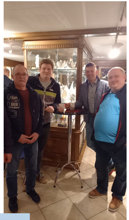
Der VDT überbrachte die Glückwünsche zur Hochzeit mit einem Blumenstrauß