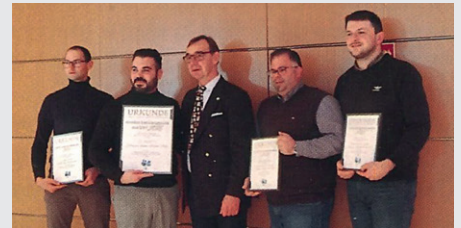
Alle Preisträger. (Grosse Zufriedenheit, unser Preis ist der größte und wichtigste.)