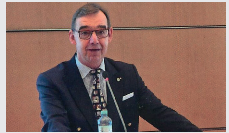
Götz Ziaja, Präsident VDT.