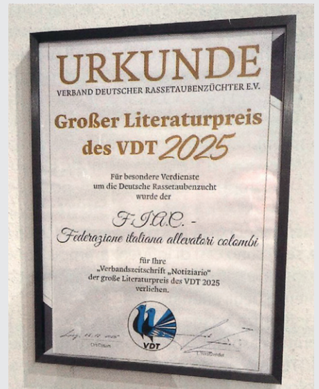
Für besondere Verdienste um die Deutsche Rassetaubenzucht wurde der F.I.A.C. - Federazione italiana allevatori colombi für ihre Verbandszeitschrift „Notiziario“ der große Literaturpreis des VDT 2025 verliehen.